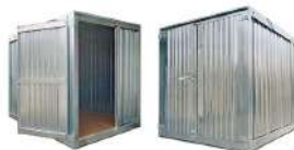
Box Attrezzi da Cantiere