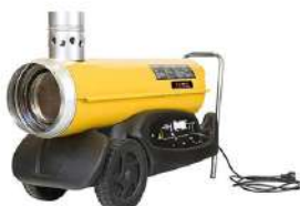
Riscaldatore a Gasolio