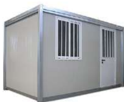
Ufficio da Cantiere