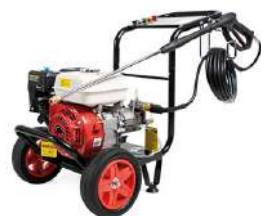
Idropulitrice a Benzina